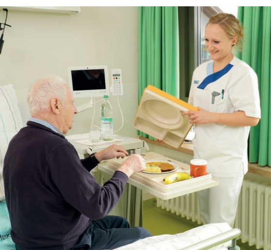
Gesunde Küche unterstützt den Heilungsprozess

Die Gesundheit steht bei uns an erster Stelle. Neben der umfassenden medizinischen Versorgung ist eine ausgewogene und gesunde Ernährung besonders wichtig. Unsere gute Küche unterstützt den Genesungsprozess und stärkt die Vitalität unserer Patienten.