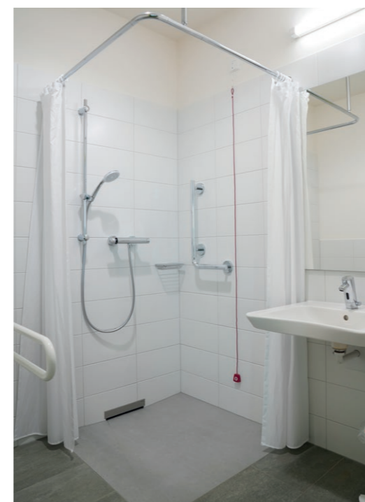
Komfortable behindertengerechte Nasszelle mit Dusche und WC