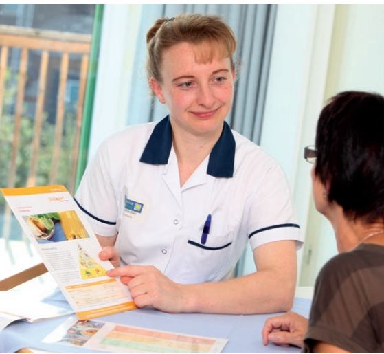
Ernährungsberatung in der Salzachklinik

Wir kochen täglich frisch mit ca. 20 % Bioanteil