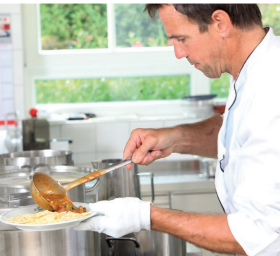
Täglich frisch gekocht in der eigenen Klinikküche