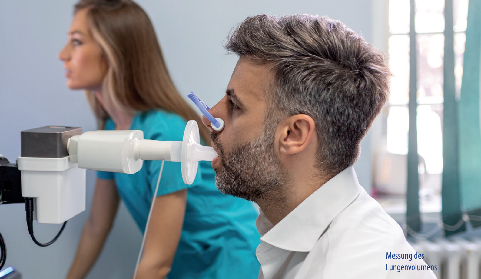
Messung des Lungenvolumens